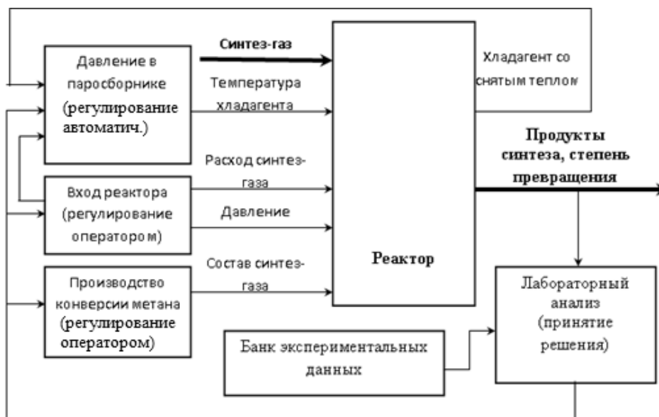
Рис. 1. Структурная схема системы управления процессом синтеза углеводородов

Определим структуру существующей системы управления. На рисунке 1 приведена структурная схема СУ. На вход реактора подается синтез-газ, а с выхода снимаются продукты синтеза (показаны жирными стрелками). На схеме показаны способы управления состоянием процесса синтеза (тонкие стрелки) [2].