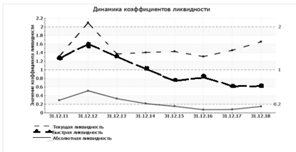
Рис. 2. Динамика коэффициентов ликвидности ООО "ПРАЙМ ГРУП" за 2011-2018 гг.

На 31 декабря 2018 г. коэффициент текущей ликвидности не укладывается в норму, хотя за последние семь лет наблюдается существенный рост (рисунок 2).