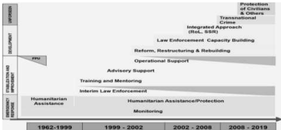
Рис. 1. Этапы развития деятельности полиции ООН.

Анализируя тенденцию развития деятельности полиции ООН с момента ее активного участия в миротворческих операциях, представляется возможным выделить следующие этапы эволюции ее деятельности (рисунок 1):